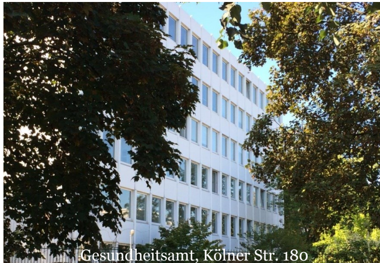
Gesundheitsamt, Kölner Str. 180